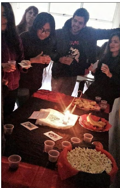
Figura 4. Instalación performática. Facultad de Ciencias Sociales, UBA, 2017