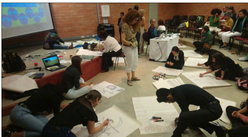
Figura 1. Autorretratos en la mesa de trabajo Corporalidad, performatividad y prácticas de enseñanza , XI Congreso Internacional de Ciencias Sociales y Humanas, Facultad de Ciencias Sociales y Humanas, Universidad de Medellín

en las que fijaron su atención, y que intentaran retratar también sus posiciones identitarias en esa situación (sexo-genéricas, étnico-raciales, de clase o lugar geográfico), es decir, algunos de los rasgos diacríticos que se inscriben en y se vinculan con sus cuerpos, y que consideren percibidos o registrados por los otros. Para este autorretrato, les pedimos que utilizaran fundamentalmente algún lenguaje visual o performático que permitiera una captación sintética de la experiencia vivida a quienes lo percibieran. Podían realizar un dibujo, fotografiarse o realizar un autorretrato performático con una postura o secuencia breve de gestos y movimientos, tal como se muestra en la figura 1.