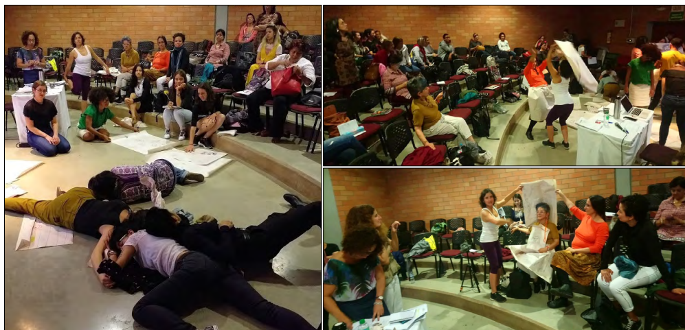
Figura 6. Intervención de los autorretratos en la apertura de la mesa de trabajo Corporalidad, performatividad y prácticas de enseñanza . XI Congreso Internacional de Ciencias Sociales y Humanas, Facultad de Ciencias Sociales y Humanas, Universidad de Medellín