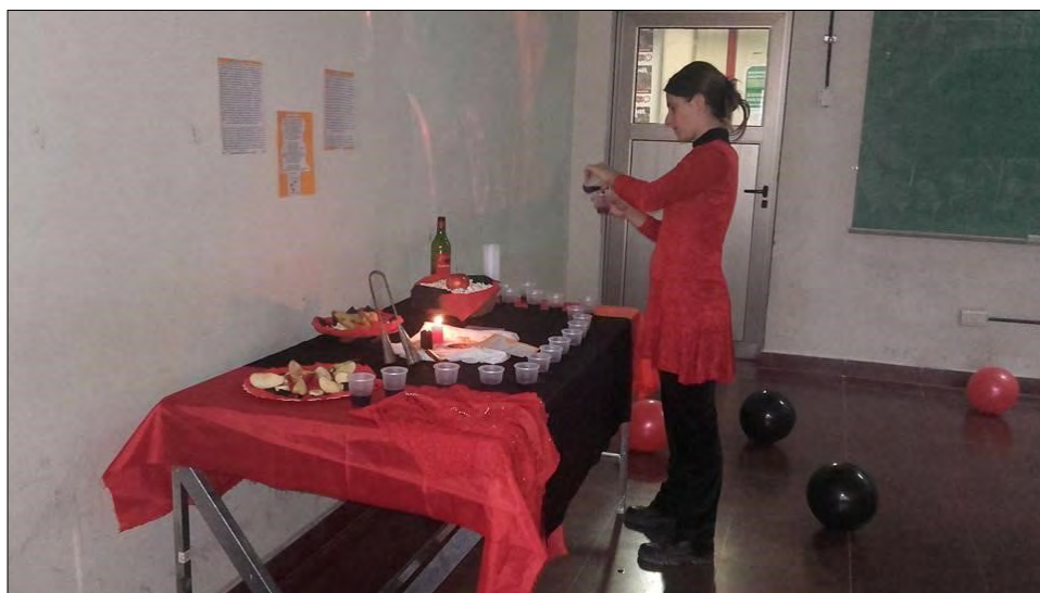
Figura 3. Instalación performática. Facultad de Ciencias Sociales, UBA, 2017