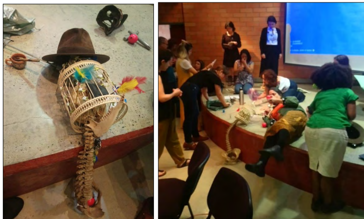
Figura 5. Corpoinstalación, en la apertura de la mesa de trabajo Corporalidad, performatividad y prácticas de enseñanza , XI Congreso Internacional de Ciencias Sociales y Humanas, Facultad de Ciencias Sociales y Humanas, Universidad de Medellín

Finalmente, un último ejemplo fue nuestra sugerencia para la corpoinstalación colectiva con la que iniciamos la mesa de trabajo en el mencionado congreso de la Universidad de Medellín (figura 5). Para ello, se le pidió a cada ponente que trajera consigo una materialidad que evocara alguna dimensión de su trabajo.