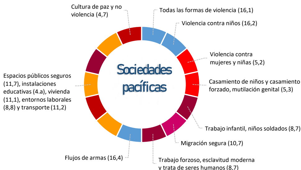
Figura 1. Eje 1 del objetivo dieciséis de la Agenda 2030

Para enfrentar la realidad descrita en líneas anteriores, el objetivo dieciséis de la Agenda suscribe a tres ejes temáticos que delimitan sus principales líneas de acción: el primero corresponde a la construcción de sociedades pacíficas; el segundo, a las sociedades justas; y el tercero a las sociedades inclusivas. Cada uno de estos ejes no solo recupera del propio objetivo dieciséis metas afines a la línea de acción atendida, sino también de distintos objetivos de la Agenda. De esta forma, los distintos ejes temáticos de las líneas de acción del objetivo dieciséis aglutinan esencialmente metas de la Agenda afines a su realización. Las gráficas que a continuación se plasman (figuras 1-3) ilustran lo anterior con mayor precisión.