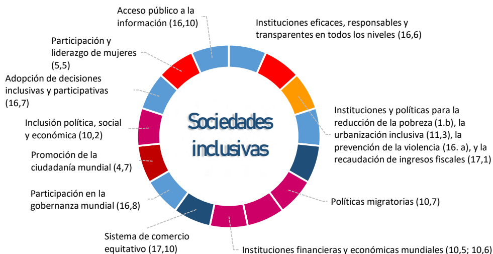
Figura 3. Eje 3 del objetivo dieciséis de la Agenda 2030