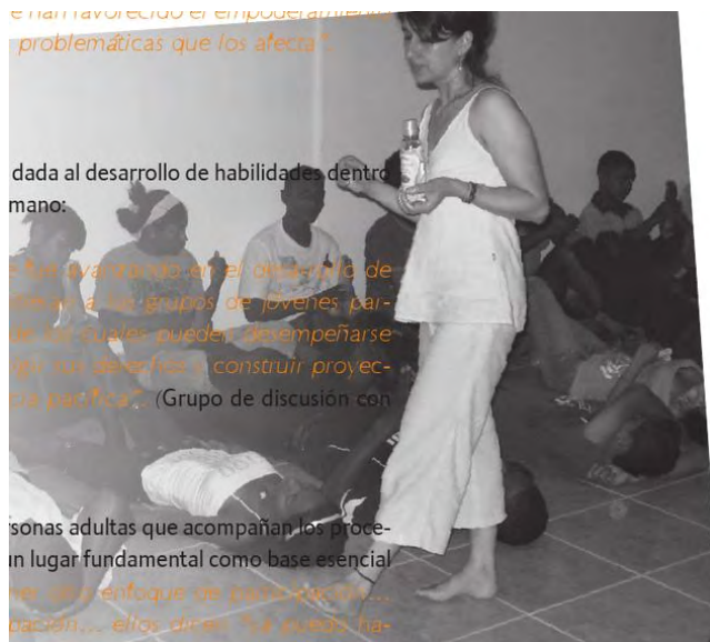
Imagen 3. Taller de reflexología con jóvenes

las personas realizan, no fenómenos que les ocurren después de terminados los procesos políticos, culturales e históricos en los que participan.