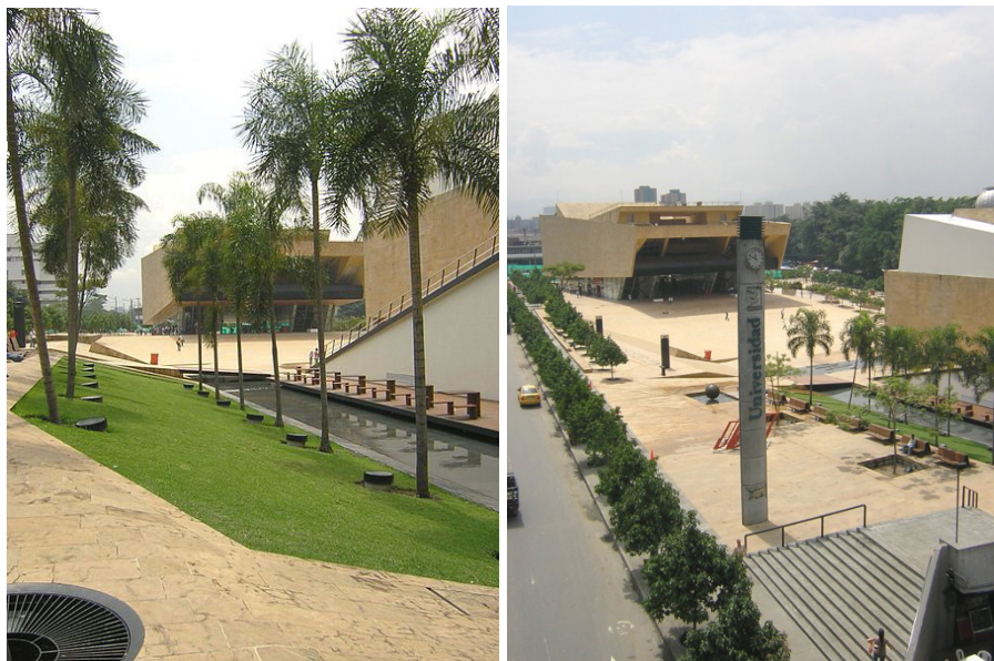
Fotografías 4 y 5. Parque de los deseos.

Otro ejemplo lo constituye el Parque de los Deseos, donde se presenta otra de las imágenes innovadoras de la ciudad, que escenifica una especie de museo de la ciencia dentro de una amplia zona temática que pretende tener valor cívico e identitario (fotografías 3 y 4).