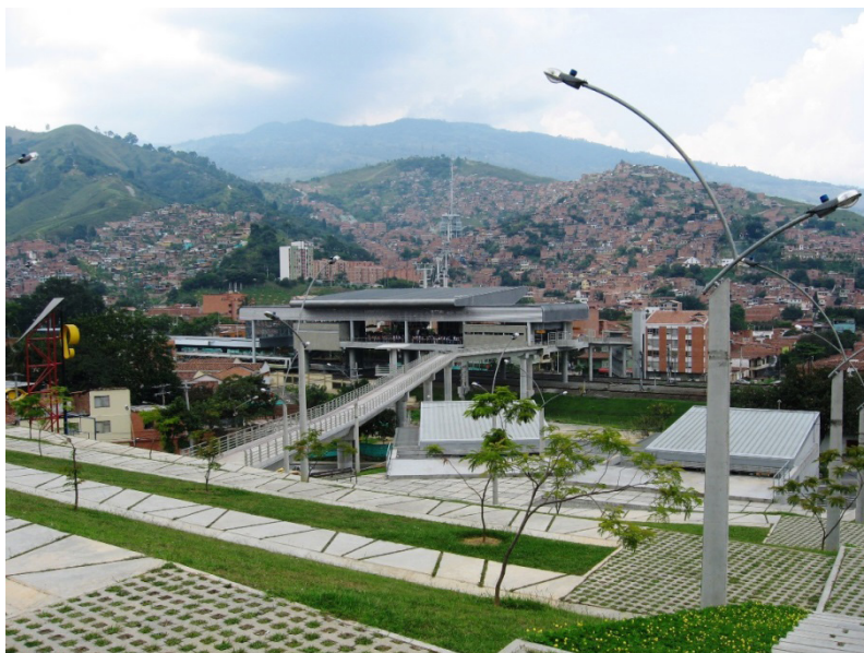
Fotografía 6. Plazoletas del metro de Medellín y amoblamiento urbano del metro.

simples, espacios abiertos, jardines medidos y la introducción de los mismos materiales que construyeron el sello del estilo arquitectónico que el modelo Metro impone. El amoblamiento urbano del proyecto Metro, el espíritu del concreto, es considerado como uno de los principales discursos del progreso urbano y del orgullo y la pujanza paisa . Este modelo se observa en las imágenes de ciudad, en relación con la exaltación de los avances en materia de movilidad amigable con el medio ambiente y pensando en el transeúnte como colectivo, dejando conscientemente de lado a quien usa de manera particular dichos espacios.