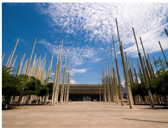
Fotografía 1: Plaza de la Luz. Antigua plaza Cisneros.