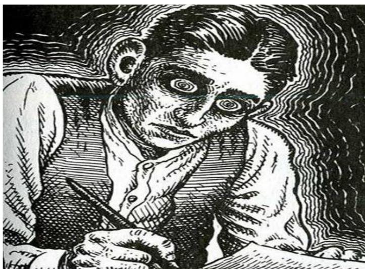
Imagen 3. Antony Hare, 2007, Kafka.

inclinado sobre el papel y con los ojos desorbitados de quien ha visto lo imposible. Su ser tiembla y se estremece ante el acontecer de la escritura, es su vida la que se conjuga en las palabras que escribe (Imagen 3). Y, sin embargo, el arte no puede ser la vida misma. Ello implicaría pararnos de frente a un hecho real y concreto, su función no es ni afirmar ni demostrar lo real. Digamos entonces, que como el lenguaje, el arte es un acto de fe.