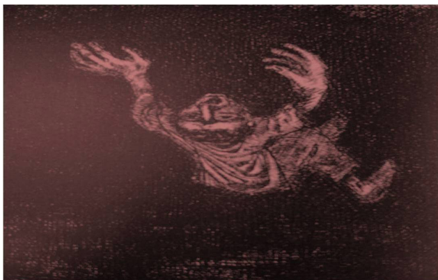
Imagen 2. 45c, Marta Kremer, Das Urteil - La condena / El veredicto

La serigrafía número 45c de Martha Kremer, Das Urteil - La condena / El veredicto (imagen 2), muestra un ser que cae en medio de la oscuridad. Sus manos y pies flotan; las primeras son desmesuradas, como si con ellas se aferrara a la oscuridad. Su gesto es de un ser temeroso y angustiado, de un hombre-topo que trasiega por túneles oscuros y solitarios, y que presiente su caída. Busca con su mirada la existencia de algo más que su sombra, se apoya en sus manos, que lucen hinchadas, como si acaso les doliera la oscuridad. Es una imagen de lo adverso que nos acerca a la narración kafkiana; un ser angustiado y en medio de la soledad. Con la obra de Kramer es posible apreciar la invisibilidad de lo otro, lo insoportable de ser invadido por formas que desconocemos.