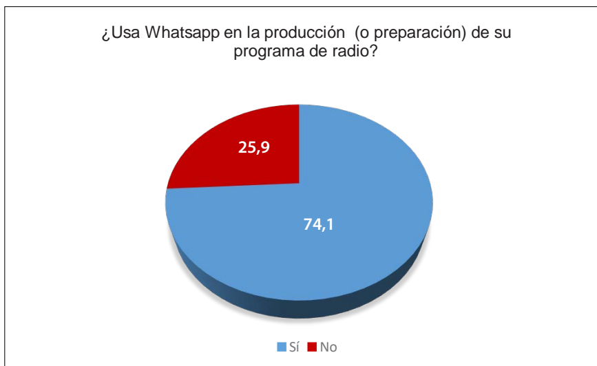
Gráfica 1. Uso del WhatsApp en la producción