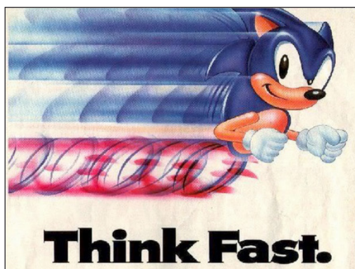
Figura 1. Anuncio de Sonic, el erizo (Pettus, 2013)

Retornando al personaje de Sega, de todas sus características, había una que sobresalía del resto: su velocidad (figura 1). Esta característica no fue escogida al azar, pues la rapidez del erizo azul permitió a Sega que la población pudiera asociar la tríada personaje-videojuego-videoconsola como un todo y comparar los avances tecnológicos de su consola de 16 bits, Mega Drive , frente a la aún vigente (y muy rentable) NES de 8 bits, siendo la rapidez un concepto más fácil de entender por la sociedad, que un simple aumento de bits entre diferentes videoconsolas.