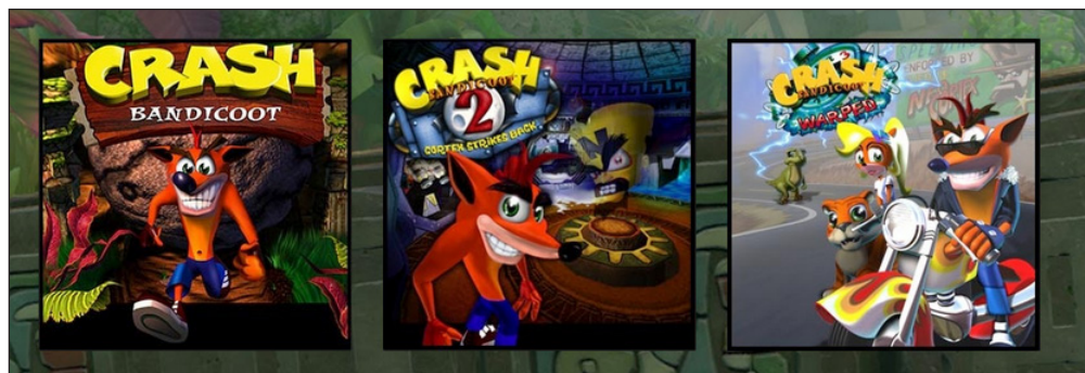
Figura 2. Carátulas de videojuegos de la saga Crash Bandicoot

Si Mario era la franquicia estrella de Nintendo y Sonic lo era de Sega, la mascota corporativa de Sony podría identificarse en Crash Bandicoot (figura 2), videojuego protagonizado por Crash, el personaje de la franquicia de juegos que lleva el mismo nombre, el cual fue creado en 1996 por la compañía estadounidense Naughty Dog (Martínez, 2016) en exclusiva (inicialmente) para la consola PlayStation. Crash es el protagonista de un juego de plataformas y, al igual que Sonic, es un animal antropomórfico, si bien se diferencia del erizo azul en que presenta una personalidad más de estilo grunge 7 , más ingenua y despiadada que la mascota de Sega de tal forma que el humor logra, en esta saga de juegos, una mayor presencia que en las franquicias de Mario y Sonic.