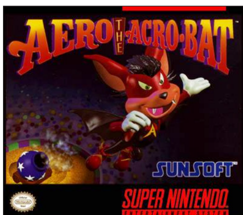
Figura 4. Portada del videojuego Aero the acro-bat para Super Nintendo

Con la creación en 1993 (por parte de Iguana Entertainment para Sunsoft) de un videojuego del clásico género de plataformas horizontales en dos dimensiones protagonizado por un murciélago acróbata: Aero, the acro-bat (figura 4), elaborado para las videoconsolas de sobremesa Super Nintendo , Mega Drive y para la portátil Game Boy Advance , Sunsoft vio en el nacimiento de este mamífero volador, la posibilidad de tener una mascota carismática que fuera el símbolo de la empresa, siguiendo la tendencia de la época.