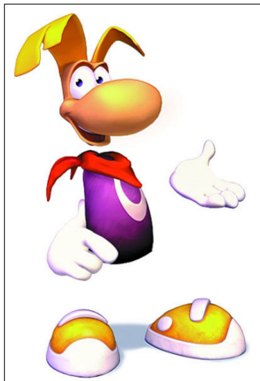
Figura 3. Rayman, el personaje de videojuegos de Ubisoft

El personaje de Ubisoft comparte con otros seres de videojuegos la capacidad de volar-planear y se diferencia de otros en que su existencia y propia personalidad no están tan bien definidas. Se puede afirmar que esta figura tiende a actuar de forma infantil, alegre e impulsiva y su personalidad es una mezcla de características dulces o kawaii (como los personajes de Nintendo) y cool (como los personajes de Sega).