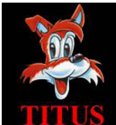
Figura 7. Logo empresarial de Titus Interactive

En 1991 la compañía francesa Titus Interactive creó el videojuego Lagaf: Les Aventures de Moktar , cuyo protagonista era el humorista y presentador de televisión francés Vicent Lagaf. El éxito de este producto en su país natal, llevó a la compañía a modificar el juego para el mercado internacional, al igual que hizo Nintendo con Super Mario 2 , sustituyendo a este cómico por la propia mascota de la compañía y creando, un año después, el juego Titus the Fox: To Marrakech and Back , una simple y burda adaptación del anterior producto, que tuvo una mala acogida ante el público.