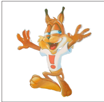
Figura 5. Bubsy, el personaje diseñado por Accolade

Una característica básica de este personaje es el uso de constantes muletillas para lograr el tan ansiado aplauso de los amantes de los videojuegos (Griefas, 2010, p. 168), estrategia que ya, anteriormente, había aplicado con enorme éxito Bugs Bunny (el personaje de dibujos animados de los años 40) y su célebre frase "Eh... What's up, doc? ".