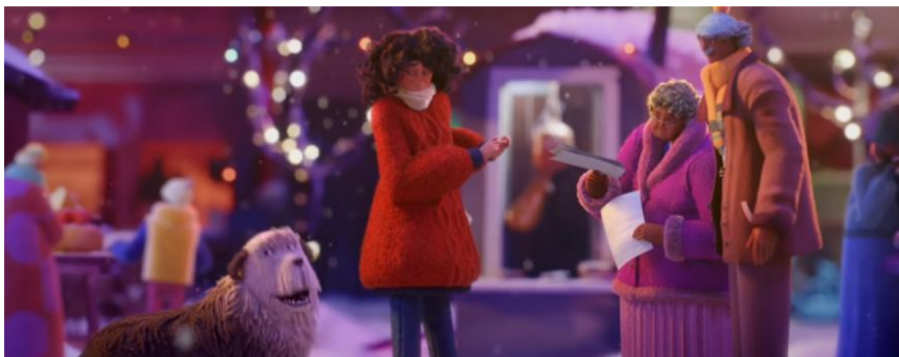
Figuras 3, 4 e 5. Cenas do comercial da campanha natalina da Apple Share your gifts (2018)

Fonte: Trecobox. https://trecobox.com.br/2018/11/22/novo-comercial-de-natal-da-apple-promete-tocar-seu-coracao/