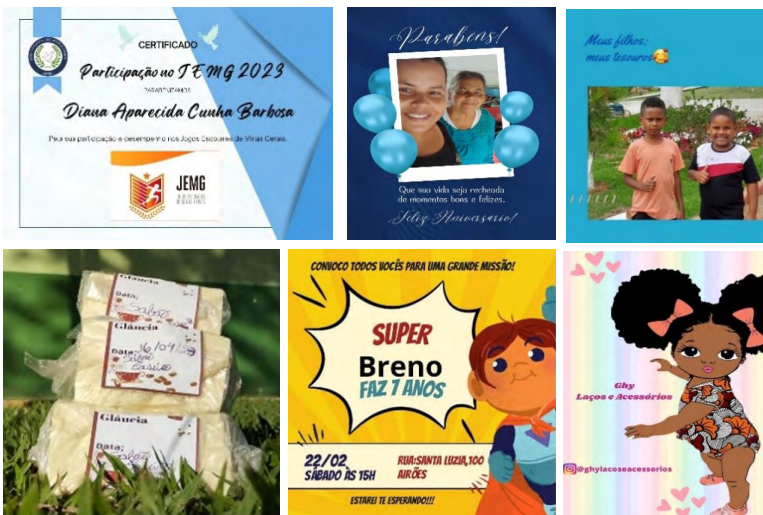
Figura 3. Artes y fotografías

Las mujeres usaron el conocimiento de literacidad digital en su vida cotidiana para anunciar sus productos, como profesoras y en la vida familiar, pero se observaron pocos cambios en la producción de contenido comunitario en la cocm. Sobre el uso del Canva en la rutina escolar, la profesora CM 04, 42 años, mencionó que el aprendizaje en los talleres mejoró la comunicación entre la escuela y las familias. "Las personas que trabajamos en el aula podemos hacer artes, cuando enviamos mensajitos para casa (del alumno), hacemos un arte y no necesitamos explicarlo, la familia lo entiende, ¡es muy bueno!".