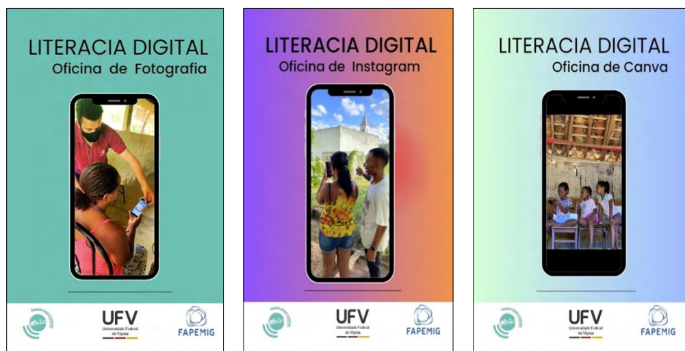
Figura 1. Material didáctico de los talleres

La etapa preparatoria de la investigación involucró encuentros con las líderes comunitarias para planificar las actividades, escuchar las demandas y articular las agendas 7 . Después, desarrollamos el material didáctico para los talleres de Canva, Técnicas de Fotografía e Instagram, con imágenes de personas de la comunidad en un intento de aproximar y valorar a esas mujeres (véase Figura 1).