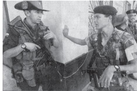
POLICÍA Y GUERRILLA dieron una lección de tolerancia. AFP

POLICÍA y GUERRILLA dieron una lección de tolerancia. El Tiempo/ enero ocho/ AFP