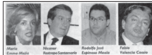
Gobierno designó a sus voceros. El Colombiano/cinco de enero de 1999. Colprensa. Primera página.

A partir de las necesidades de la fotografía de prensa o documental (Colle. 1998: 25) en la muestra encontramos como necesidad predominante del receptor recordar , definida por este autor como la necesidad de que se le recuerden al emisor, actores, lugares o herramientas. Esta necesidad se evidencia en las imágenes publicadas por ambos medios de los voceros del gobierno, que pese a ser personajes públicos debían ser mostrados nuevamente.