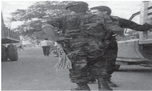
Foto MANUEL SALDARRIAGA, enviado especial se instalará la mesa de diálogo entre el Gobierno y Farc. Luego de este acto histórico continuará la dis- cusión sobre los temas de la agenda. Desde ya los insurgentes mantienen control estricto en las calles de San Vicente del Caguán. El Colombiano / enero cinco / Manuel Saldarriaga

San Vicente del Caguán, Caquetá. El siete de enero se instalará la mesa de diálogo entre el Gobierno y Farc. Luego de este acto histórico continuará la discusión sobre los temas de la agenda. Desde ya los insurgentes mantienen control estricto en las calles de San Vicente del Caguán. El Colombiano / enero cinco / Manuel Saldarriaga