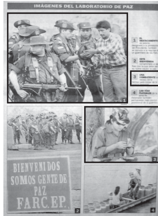
UNA COMBATIENTE en receso tiene tiempo para cuidar de la belleza personal. El Tiempo / enero siete/ AFP.

La otra imagen de esta pieza que se encuentra señalada también se repite. En este caso podríamos decir que las diferencias en el tratamiento son mayores. Mientras El Colombiano muestra el encuentro en términos de cordialidad e, incluso, finaliza el pie de foto con el siguiente testimonio sin atribución: «Esto es una prueba de que en el país puede alcanzarse la paz»; El Tiempo nos habla de una realidad muy distinta. En el pie de imagen dice: EL DESTACAMENTO de policía designado a la protección del Presidente también se somete a la requisa de un guerrillero de las Farc. Un texto que sugiere y una imagen que muestra una relación en la cual las tensiones y la desconfianza están presentes.