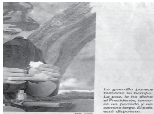
La guerrilla parece tomarse su tiempo. La Paz, lo ha dicho el Presidente, tomará un período y un camino largo. El país está dispuesto. AFP.

La guerrilla parece tomarse su tiempo. La Paz, lo ha dicho el Presidente, tomará un período y un camino largo. El país está dispuesto. El Colombiano/ enero siete /AFP.