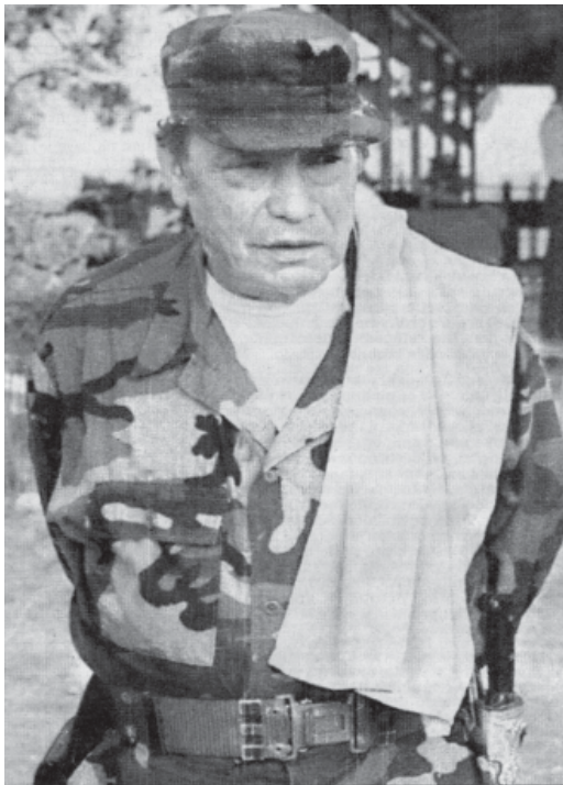
'TIROFUJO', ayer en su campamento cerca a San Vicente del Caguán.

entre las necesidades mencionadas por este autor hay una específica, que obedece a la necesidad de mostrar lo que estaba pasando, y está tipificada como una necesidad del emisor, la necesidad de comprobar . Esta necesidad queda claramente evidenciada en las múltiples imágenes de guerrilleros armados en el casco urbano del municipio de San Vicente del Caguán, la ausencia de Marulanda y su posterior aparición con algunos de los asistentes al acto para comprobar su presencia en la zona.