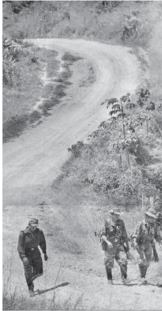
EL SINUOSO camino de la paz está, sin embargo, lleno de alternativas viables. Fernando Vergara/ Encuentro Español de El Tiempo

EL SINUOSO camino de la paz está, sin embargo, lleno de alternativas viables. El Tiempo/ enero 6 / Fernando Vergara