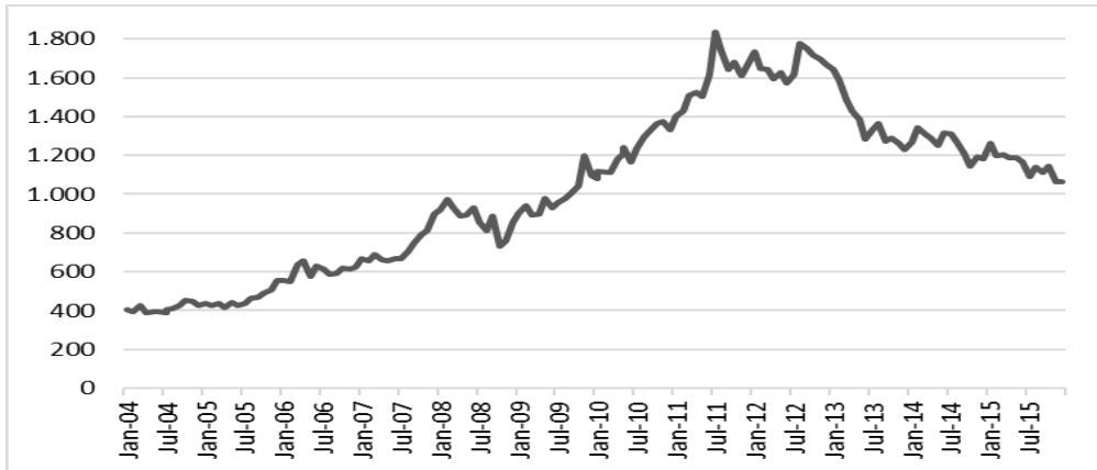
Gráfica 1. Cambios en el precio de oro 2004-2015 (USD / Onza)

Fuente: tomado de BullionVault Gold Price Chart