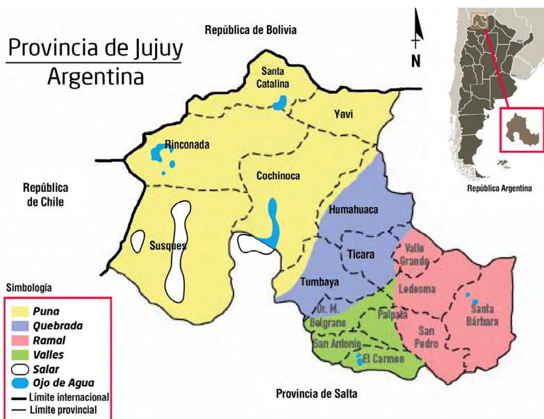
Mapa 1. Regiones de la Provincia de Jujuy y posición relativa en la República Argentina.