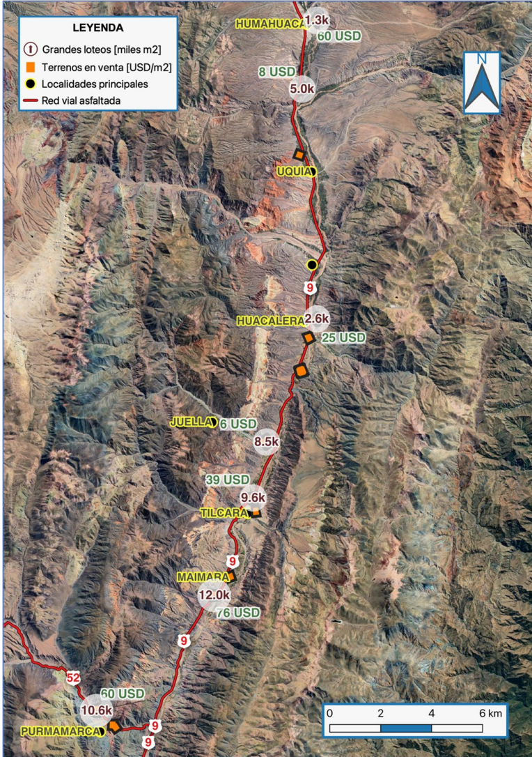
Figura 3. Terrenos en venta y grandes loteos. Quebrada de Humahuaca. Año 2023.