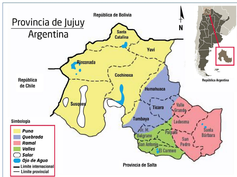
Figura 1. Regiones ambientales de la Provincia de Jujuy.