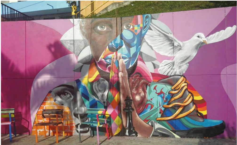
Imagen 2. muralismo en Medellín.