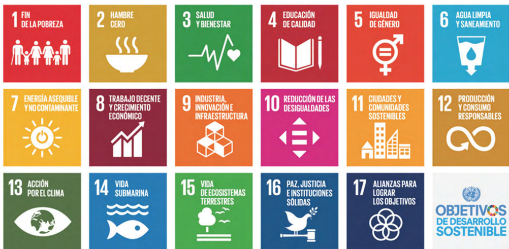
Figura 1. Los diecisiete objetivos de desarrollo sostenible